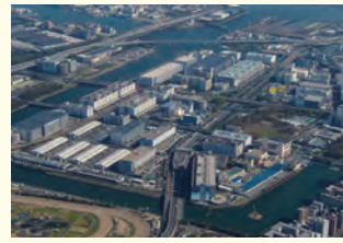
■本社や管理施設のある平和島

赤い電車でおなじみの京急グループ会社で、さまざまな施設を運営したり、管理をしたりする会社です。本社のある大田区平和島に「BIGFUN平和島」「天然温泉平和島」「平和島スターボウル」「ボートレース平和島」などの楽しい施設を運営・管理し、この地域の活性化に取り組んでいます。私たちが関わっている施設は平和島以外にもあり、すべてを合わせると東京ドーム約4個分の広さがあります。